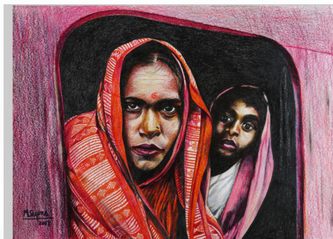
Fotografía original de Steve McCurry. India Dibujo con lápices de colores Serie: Cienicientas y Cienicientos