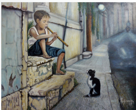
Niño callejero. Chipre Óleo sobre lienzo Título: La flauta mágica