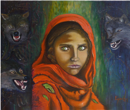
Óleo sobre lienzo Serie: Los cuentos Título: Capercita Roja