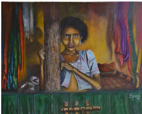
Fotografía original de Steve McCurry. Nómadas Óleo sobre lienzo Serie: Cienicientas y Cienicientos Título: Ropa limpia