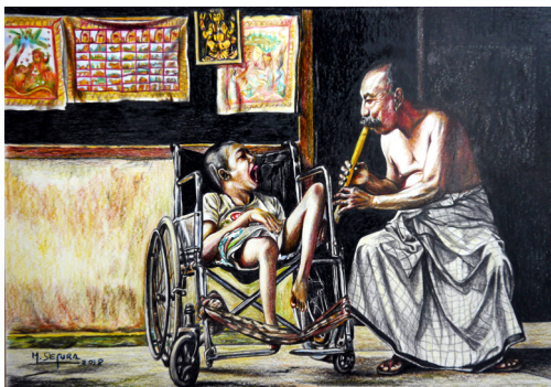
Dibujo con lápices de colores Serie: Música y encantamientos Título: El músico del amor. Bali