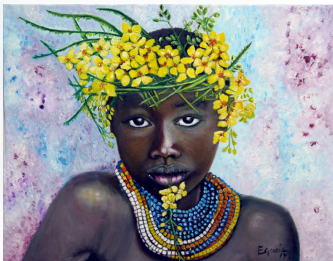
Fotografía original de Steve McCurry Joven del Valle del Omo Óleo sobre lienzo Serie: Cienicientas y Cienicientos Título: Iniciación