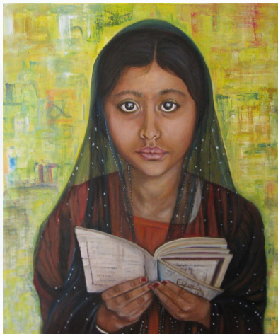
Fotografía original de Steve McCurry