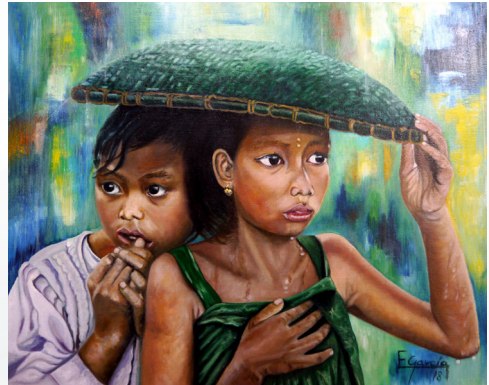
Fotografía original de Steve McCurry. Monzón Óleo sobre lienzo Serie: Los cuentos Título: Hansel y Gretel

Fotografía realizada en el campo de refugiados de Nasir Bagh por Steve McCurry cuando cubría como reportero la guerra de Afganistán, en 1984.